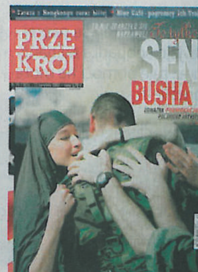
Zbigniew Libera: Osvoboditev (Busheve sanje)