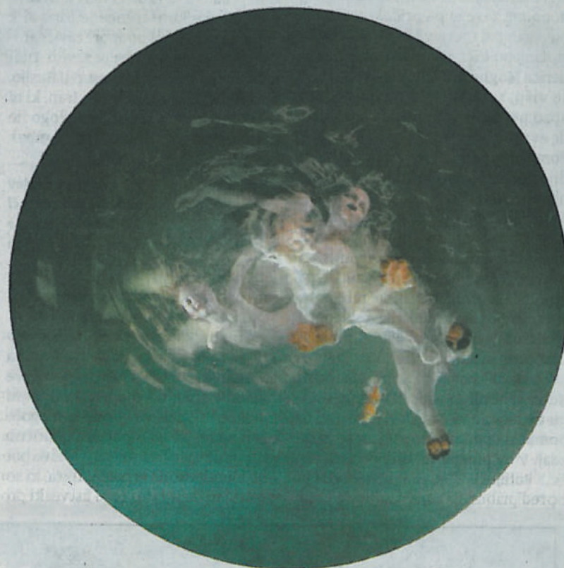
Oleg Kulik: Lolita vs. Alice

V okviru razstave MIG21 in festivala KIBLIX-MFRU 2016 bodo letos prvič podelili dve nagradi, kipca, bela aphroida 2016, in sicer beli aphroid za umetniške presežke in beli aphroid za inovativne izobraževalne pristope v polju umetnosti. Nagrajence bo izbrala skupina petih mednarodnih ekspertov na področju umetnosti. Vrednost nagrade v obeh kategorijah je 1500 evrov. Nagrajenci bodo znani novembra.