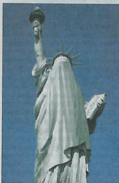
AES+F: Islamski projekt - priče prihodnosti

V okviru razstave MIG21 in festivala KIBLIX-MFRU 2016 bodo letos prvič podelili dve nagradi, kipca, bela aphroida 2016, in sicer beli aphroid za umetniške presežke in beli aphroid za inovativne izobraževalne pristope v polju umetnosti. Nagrajence bo izbrala skupina petih mednarodnih ekspertov na področju umetnosti. Vrednost nagrade v obeh kategorijah je 1500 evrov. Nagrajenci bodo znani novembra.