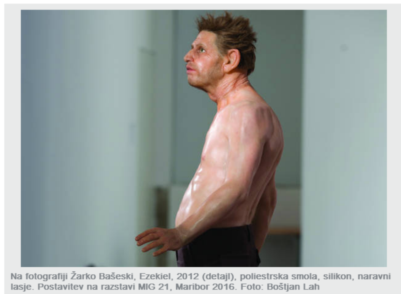
Na fotografiji Žarko Bašeski, Ezekiel, 2012 (detajl), poliestrska smola, silikon, naravni lasje. Postavitev na razstavi MIG 21, Maribor 2016.

Ključne besede: Žarko Bašeski, Kibla Portal, hiperrealistični kipi