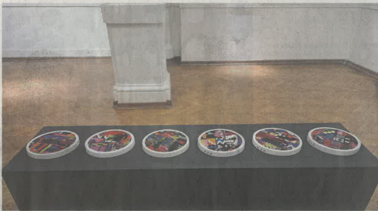
Vezenine - plafonjere