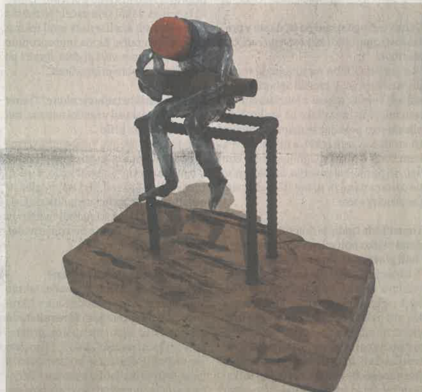
Mislec iz platenk

Projekt je nastal v sodelovanju z Muzejem Lapidarium iz Novigrada v Istri na Hrvaškem. V KiBeli bo razstava odprta do 14. marca, v artKIT-u pa do 7. marca.