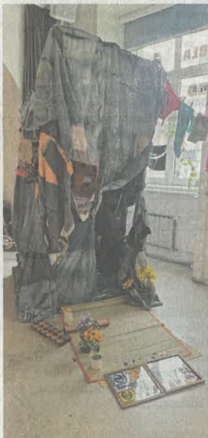
Šotor iz odpadnega tekstila, ne bistveno drugačen od tistega, v katerem živi umetnik