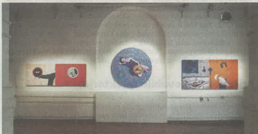
"Šubičeva slikarska dela se tako vzpostavljajo v polju subtilne napetosti med barvo, telesnostjo in pogledom."

Kot je v galerijskem listu zapisala Nina Šardi, se serija Naredi sliko umešča v dolgo tradicijo umetniškega pogleda na žensko telo – a zgolj na prvi pogled.