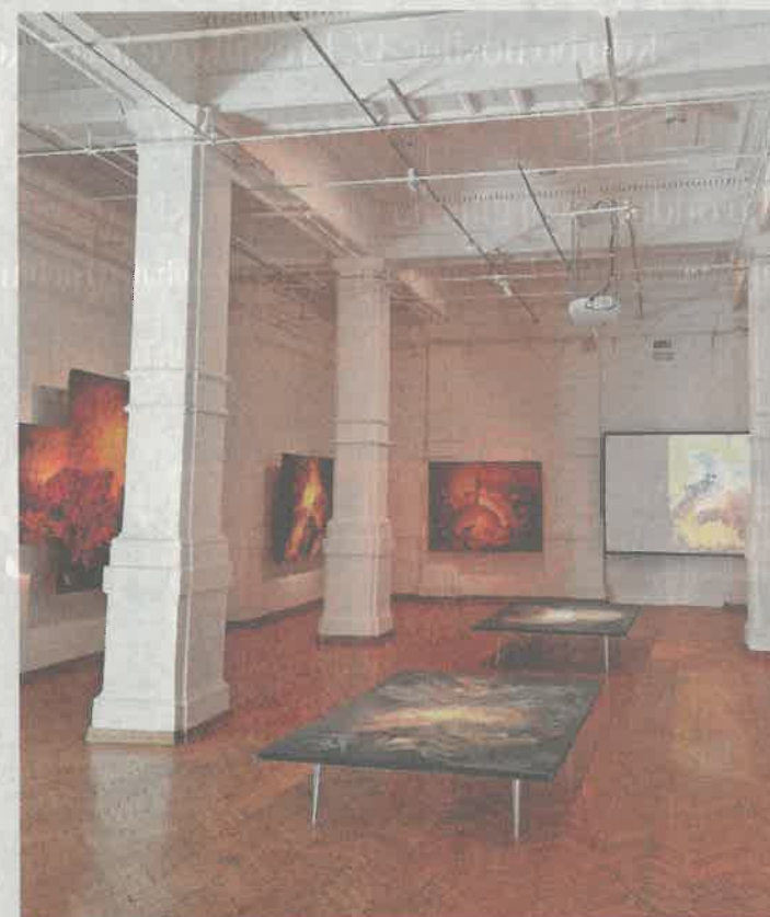
Razstava je premišljeno zasnovana in uspešno predstavi cikel, ki je kompleksen tako zaradi tematike in abstraktnosti kot zaradi velikosti in tehnike slik.

Takšna postavitev lahko deluje le v primerno velikem prostoru, ki ji dovoli dihati, hkrati pa zajema cikel na dovolj omejeni kvadraturi, da obiskovalec vse tri načine razstavljanja (stensko, talno, digitalno) dojame kot smiselno celoto, ki se dopolnjuje. Galerijski prostor je za to