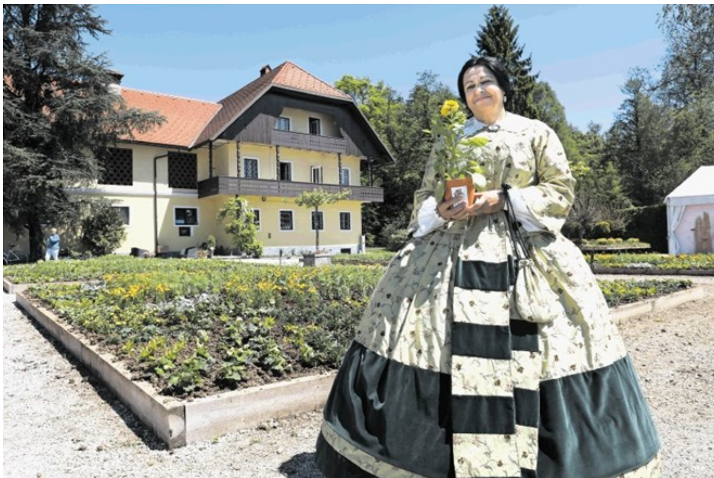
V parku se trudijo, da bi rastlinam, kot je cinija in ki jih je oboževala grofica Marija Auersperg Attems, povrnili veljavo.