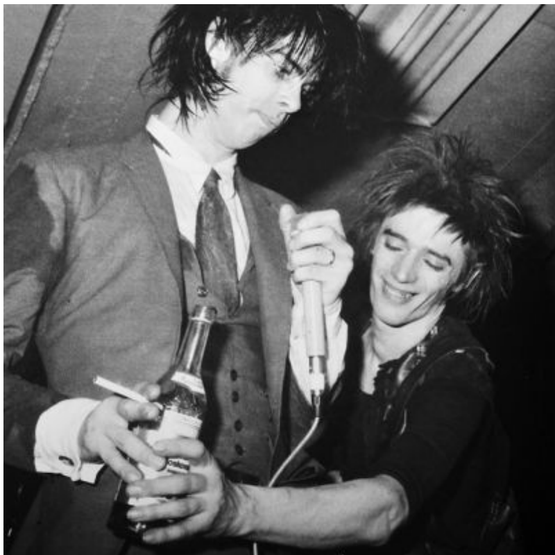
Nick Cave in Blixa Bargeld z ruskim vitaminskim napitkom v Loftu leta 1984

življenju, je uredil v nekdanji toplarni na ulici Köpenicker. Denar ga ne zanima več, zdaj se osredotoča na zdravo prehrano. Pred tremi meseci je postal presnojedec.