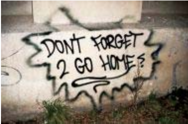
Grafit na steni Berghaina

Klubi so zvezdniki te scene, ki že desetletja vedno znova doživlja preobrazbo. Legende o nočeh v klubih, kot je Risiko, tehnorgije v Tresorju, seksualni ekscesi v Berghainu, v baru 25 in Watergatu – takšne noči so pripomogle, da je Berlin zaslovel in začel privabljati hedonistično občinstvo z vsega sveta.