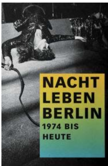
Knjiga Nočno življenje v Berlinu

A blagajna v Eisengrauu in m-clubu je ostajala precej prazna. Komerciala, to je bilo nekaj za Zahodno Nemčijo, in ljudje so se pred kapitalizmom iz Hamburga in Münchna počutili varne tudi zaradi zidu. Zid je ščitil nove boeme in zagotavljal, da so življenjski stroški ostali nizki. »Vsi so bili brez cvenka, a živeti je mogoče tudi z zelo malo denarja. Pijača je bila zastonj, obleke smo šivali sami, najemnina za enosobno stanovanje s straniščem na hodniku je znašala komaj 110 mark, elektrike pa nisem plačevala, ker sem blokirala števec.«