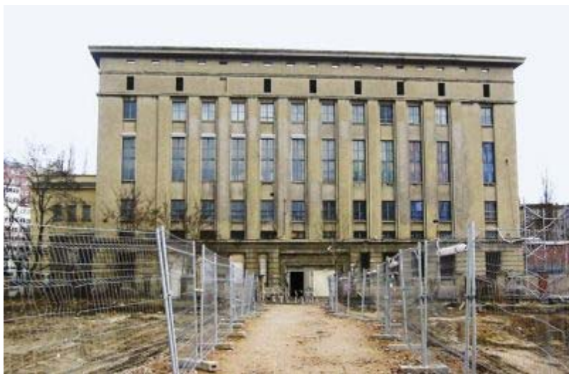
Berghain, bivša toplarna

Sama je igrala pri skupinah Einstürzende Neubauten in Malaria!, v katerih so s čistimi, elektronskimi popevkami postavili temelje za glasbo, ki je zaznamovala Berlin. Trgovino z oblačili je odprla, ker je vsepovsod vladala puščoba, kamor si pogledal, samo C & A. Oblačila je krojila tudi iz plastičnih vrečk. Sredi trgovine je stal pletilni stroj, s katerim je pletla asimetrične puloverje. Klub m-club je vodila po vzoru newyorškega prizorišča nočnega življenja Clubs Area.